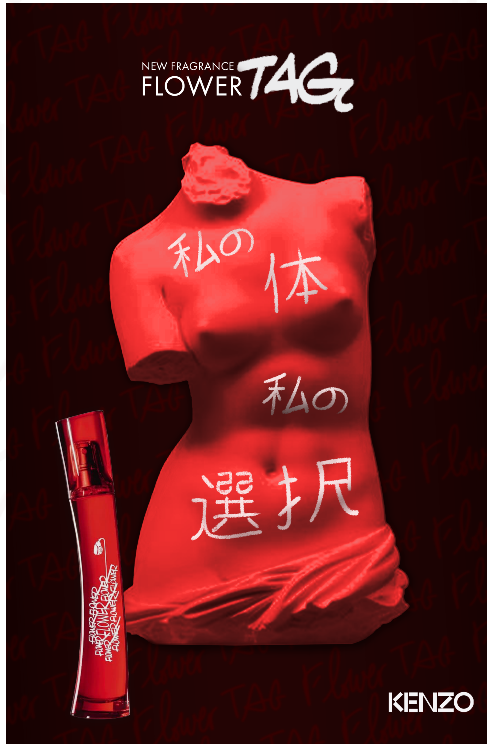
Déclinaison pour le Japon