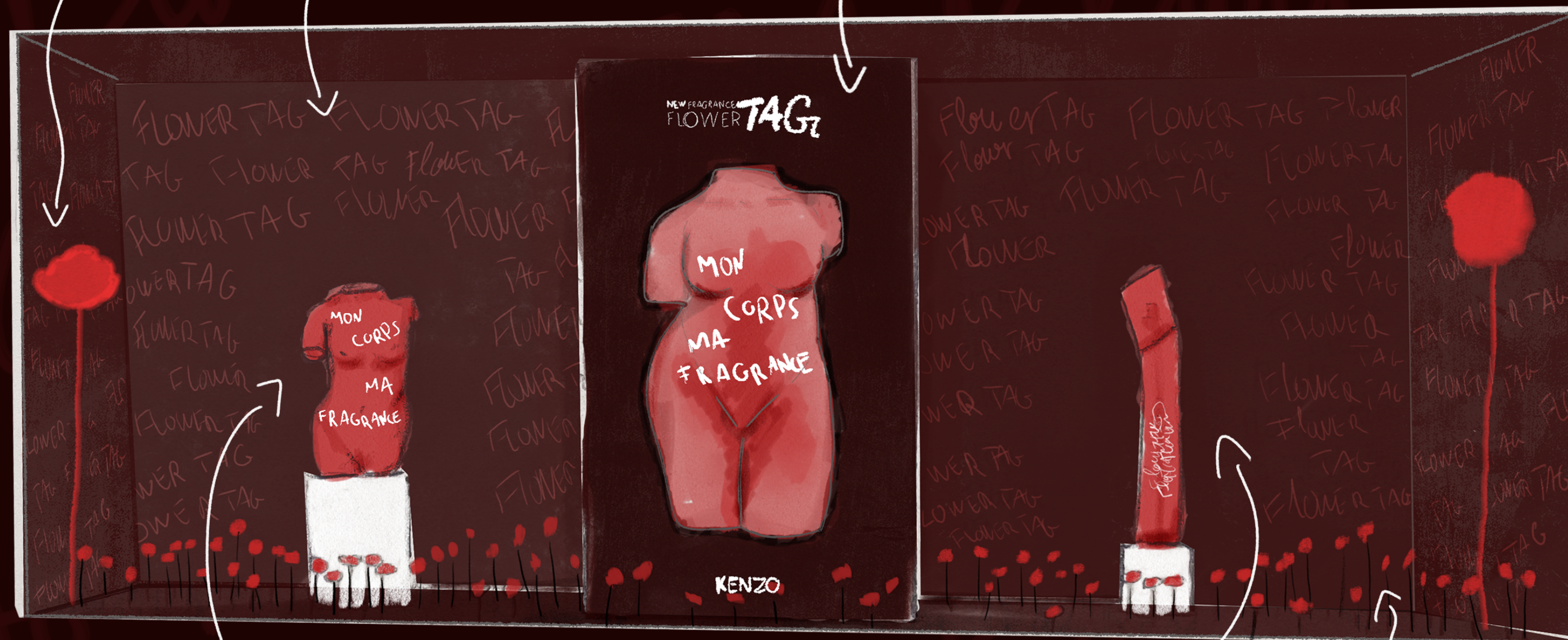
Sculpture d'un buste de femme avec le message de la campagne rappelant un message féministe